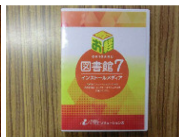
No.6 図書システム(お気軽図書館)