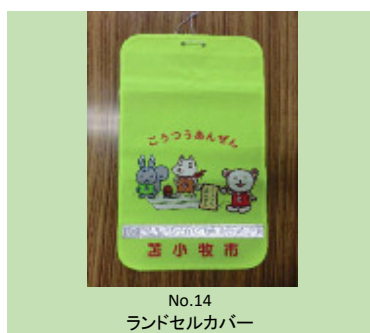
No.14 ランドセルカバー