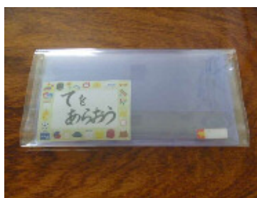
No.5 手作りマスクケース