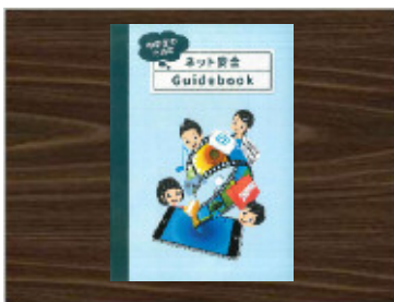
No.8 中学生のためのネット安全Guidebook